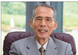
長尾 真 国際高等研究所所長

京都大学第23代総長、情報通信研究機構理事長、国立国会図書館長などを歴任。専門は自然言語処理・画像処理・パターン認識。機械翻訳国際連盟・言語処理学会を設立。レジオン・ドヌール勲章シュヴァリエ章、日本国際賞を受章。文化功労者。