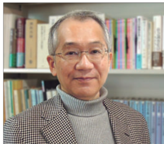
橋爪 大三郎 社会学者、 東京工業大学名誉教授

執筆活動を経て、東京工業大学教授（～2013）。専門は、理論社会学、比較宗教論など。著書に『げんきな日本論』、『戦争の社会学』、『ふしぎなキリスト教』、『面白くて眠れなくなる社会学』、『世界がわかる宗教社会学入門』、『はじめての構造主義』など。